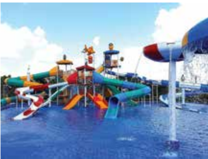
1. Águas Selvagens