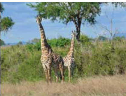
4. Sactuaray Ngunni Nacional