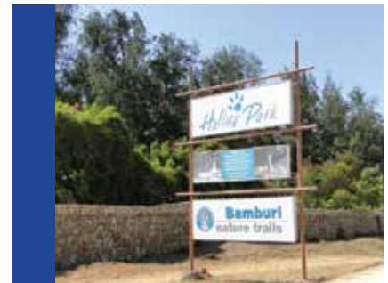
3. Parque Haller