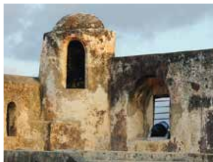
5. Fort Jesus