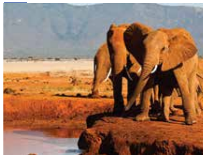
2. Parque Nacional Tsavo Leste