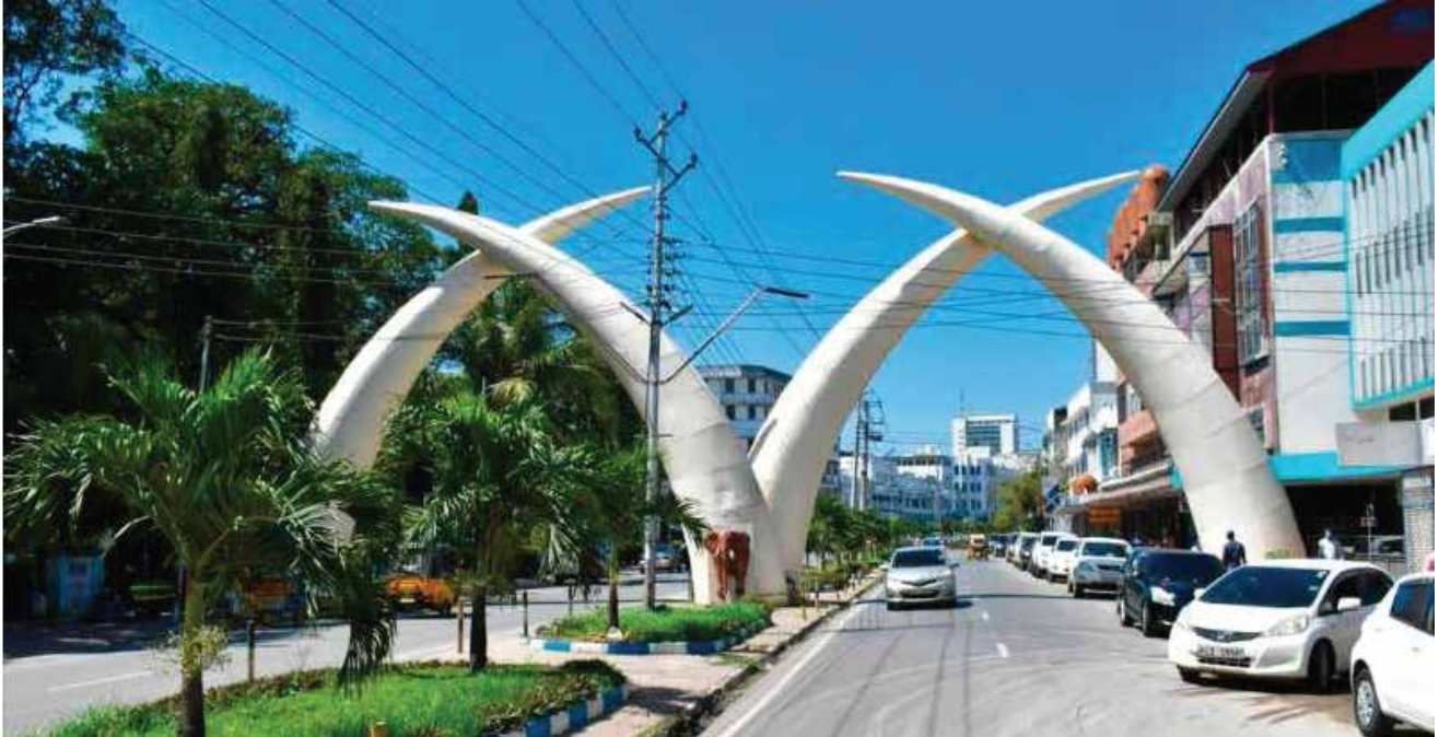
Presas de Mumbasa