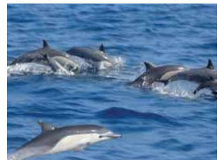
6. Nadando com os Golfinhos